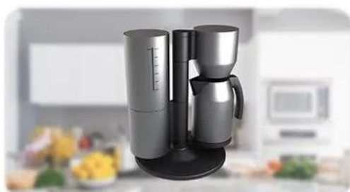
Zadanie na czas

Automatyczne gotowanie wody o godzinie 20:00.