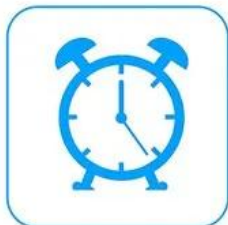
Zadanie na czas

Trzy tryby pomiaru czasu, które spełnią Twoje różnorodne potrzeby w życiu codziennym.