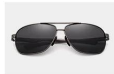
Gun / Gray