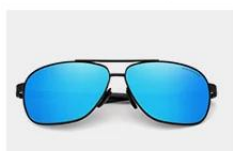
Black / Blue