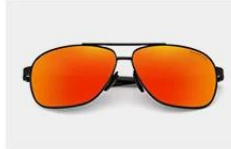
Black / Red