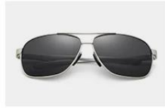
Silver / Gray