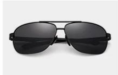
Black / Gray