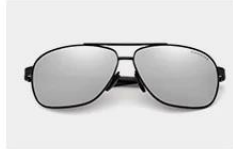
Black / Silver