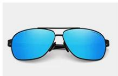
Black / Blue