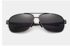
Gun / Gray