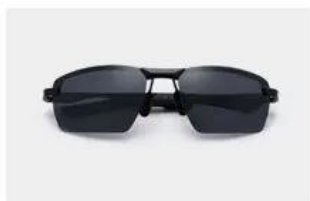
Black / Gray