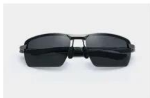
Gun / Gray