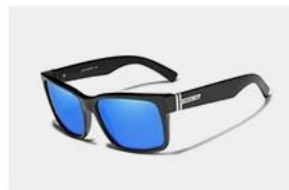
Black / Blue