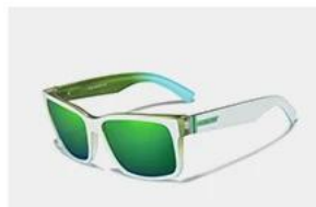
White / Green