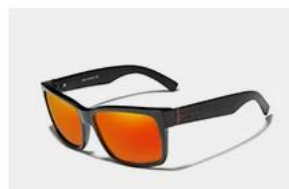
Black / Red