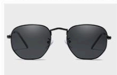
Black / Gray

Note: the size is measured by hand. There will be slight difference. Thank you for your understanding.