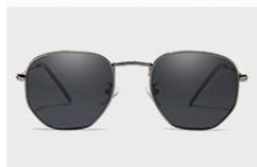
Gun / Gray