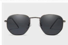
Gun / Gray