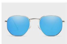
Silver / Blue