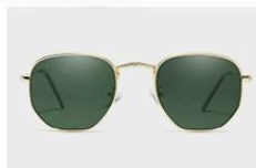
Gold / Green