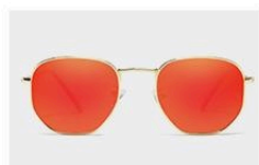
Gold / Red