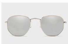
Silver / Mirror