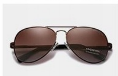
Brown / Gradient Brown