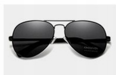
Black / Gray

Note: the size is measured by hand. There will be slight difference. Thank you for your understanding.