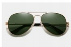
Gold / Green