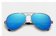
Silver / Blue