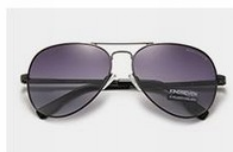
Gun / Gradient Gray