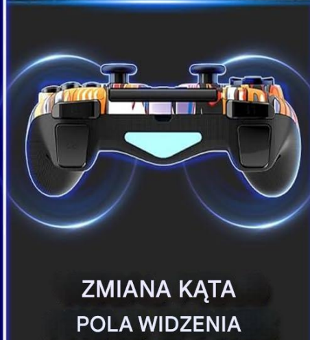
ZMIANA KĄTA POLA WIDZENIA